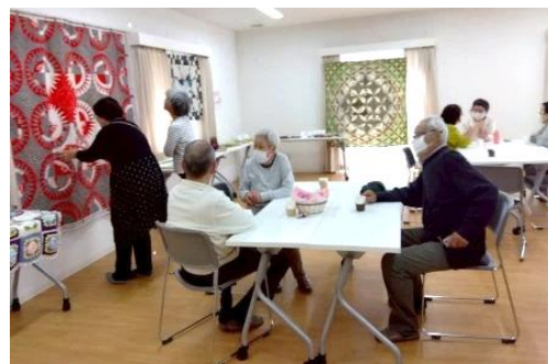
パッチワーク展示