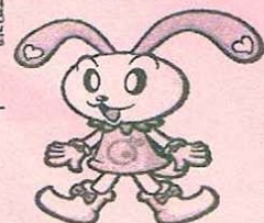
社協キャラクター 「ちょびっと」